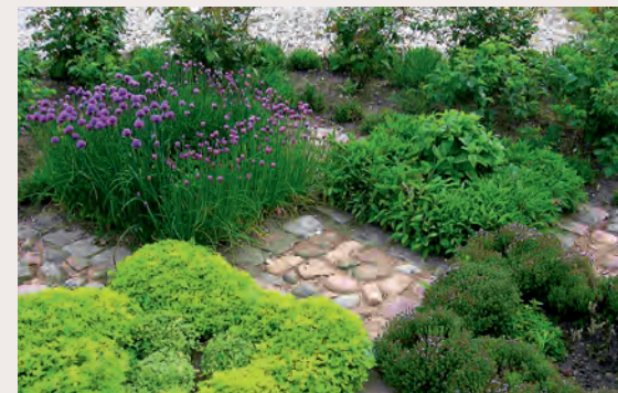
De fire kvadrater med krydderurterne guldmerian, timian, purføl og salvie.

Da gårdhaven er opbygget symmetrisk i belægningen, var det oplagt at placere planterne ligeså. Det giver et smukt og kontrolleret udtryk. Bedene er således næsten ens på begge sider af gårdhavens længderetning. De største bede mod nord og syd er beplantet med de højeste stauder og roser, hvilket giver højde og fylde i gårdhaven. Farverne er overvejende holdt