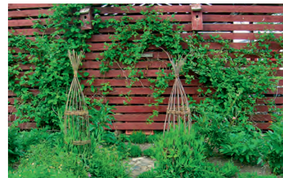
Pileflet med staudelathyrus på vej op. Op ad brændehuset er brombær på vej.