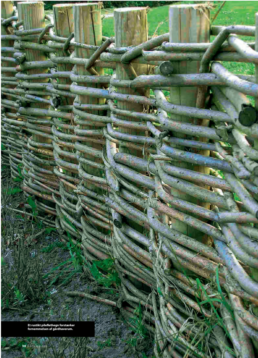
Et rustikt pileflethegn forstærker fornemmelsen af gårdhaverum.

TEKST OG FOTO: LONE SKJØDT, HAVEARKITEKT.