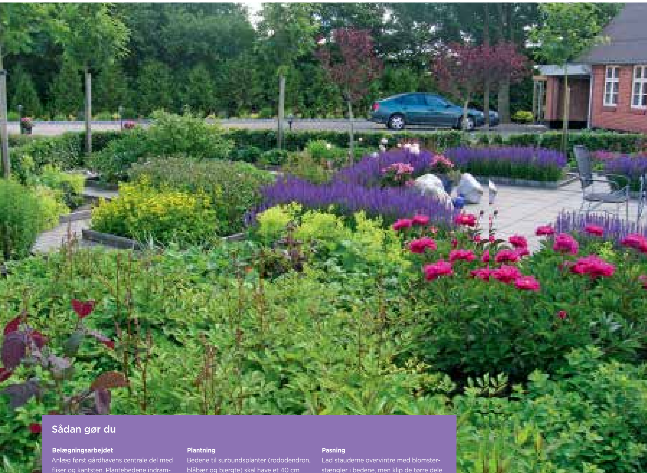
Gårdhaven set fra nordvestsiden, en sand frodighed af silkepæon 'Felix Crousse's karminrøde blomster, lodden løvefod, Alchemilla mollis , og hækken af lilla småblomstret salvie, der indrammer terrassen.